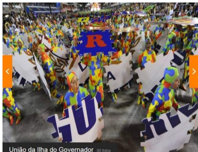
União da Ilha do Governador 80 fotos

3.mar.2014 - A ala "Quebra-Cabeças", com fantasias que carregam peças de quebra-cabeças, que formam o brasão da escola Leia mais