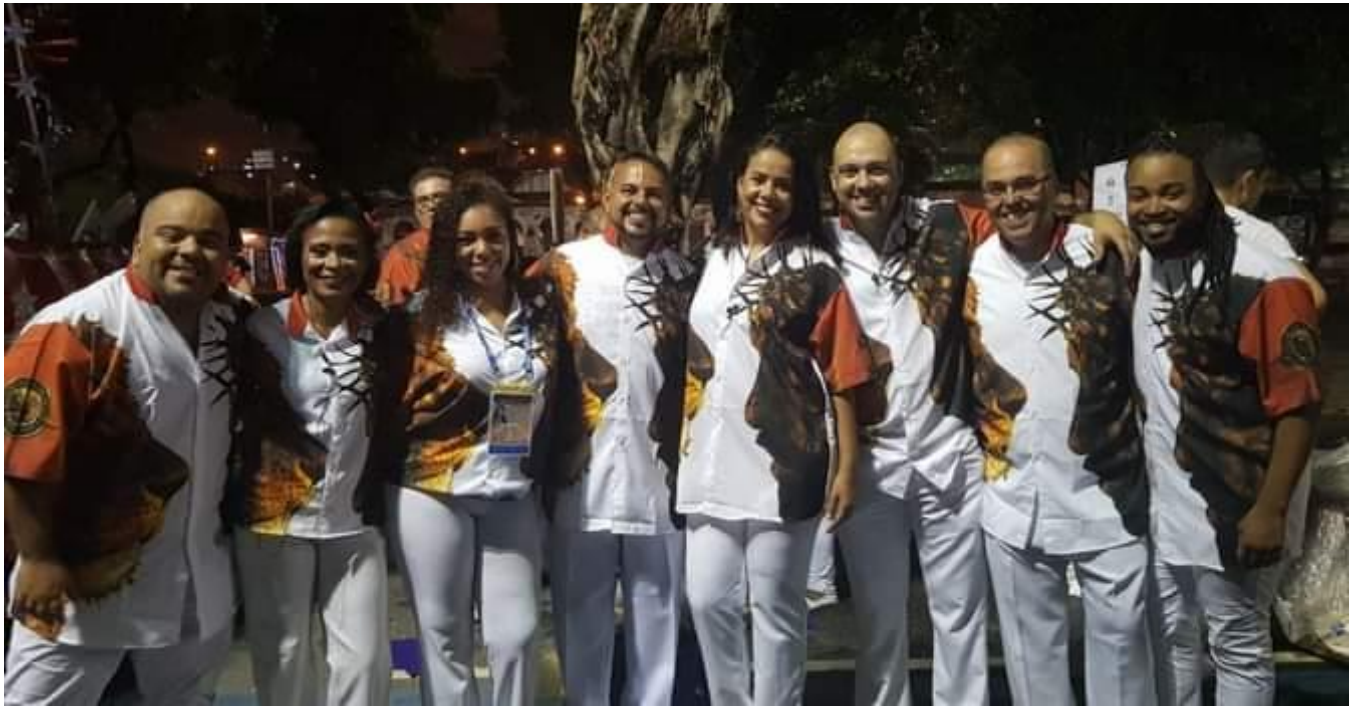
*Abre Alas com as Águas Vivas