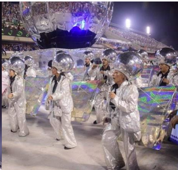
*Ala Tias Baianas