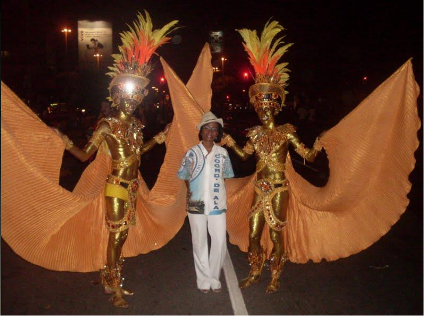
*Ala Dama do Cabaré